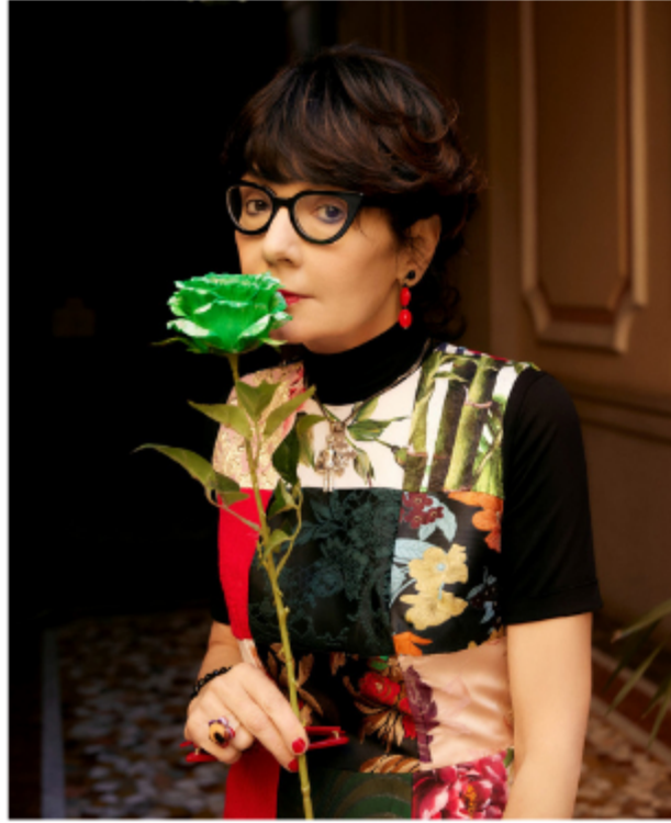
Ideata e diretta da Elisabetta Sgarbi