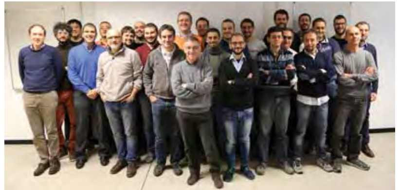
I colleghi e la sede dello Studio di Microelettronica di Pavia

senza paragone. Uno dei team più bravi al mondo, con risultati di assoluta eccellenza!”